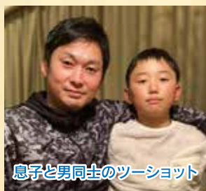
息子と男同士のツーショット

明けましておめでとうございませう。介護部リーダーの正躰です。今年の目標は「腕を磨く」です。家庭でも職場でも「男」を磨いていきます!そして、いよいよ今年40歳になるので、さらなる成長をしたいと思っています。