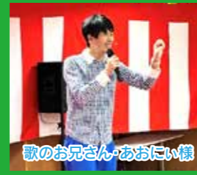
歌のお兄さん・あおにい様

コロナ禍で開催を控えていた秋祭りを今年は開催できました。地域イベントにも出演されている歌のお兄さん・あおにい様と、毎年盆踊りでお世話になっている福田地区栄養改善協議会の皆さまのご協力で、楽しい時間を過ごすことができました。